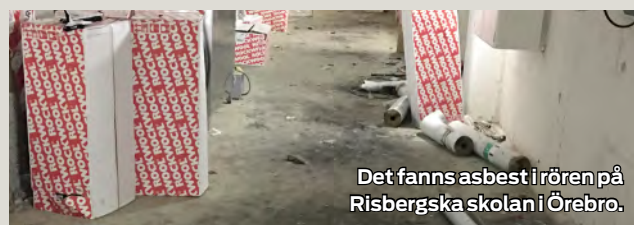
Det fanns asbest i rören på Risbergska skolan i Örebro.