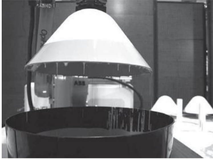
Doppmoment, Den omänskliga faktorn, Karlsson & Björk.

Robotdalen är en plattform för forskning och utveckling