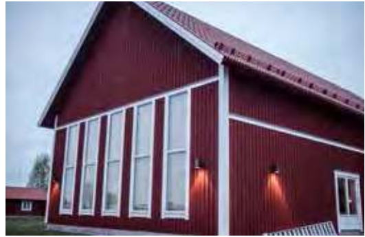
› Vattnäs operalokal tar 300 personer.