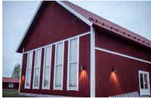
› Vattnäs operalokal tar 300 personer.