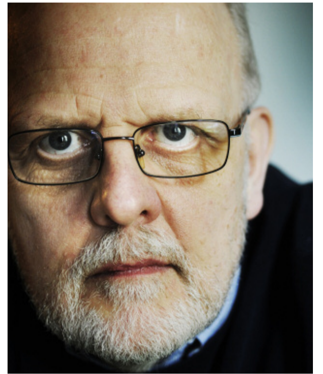
Thomas Quick, numera Sture Bergwall.

Kanske sveptes de med. Kanske trodde de först att Bergwall verkligen var monstret han påstod sig vara. Men längs vägen måste det ha blivit tydligt för samtliga inblandade att seriemördaren Quick bara var ett fantasifoster.