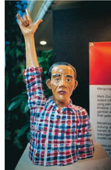
Den rutiga skjortan som Joko Widodo – och statyetterna formade efter honom – bär ska symbolisera det brokiga Indonesiens förmåga till fredlig samexistens.