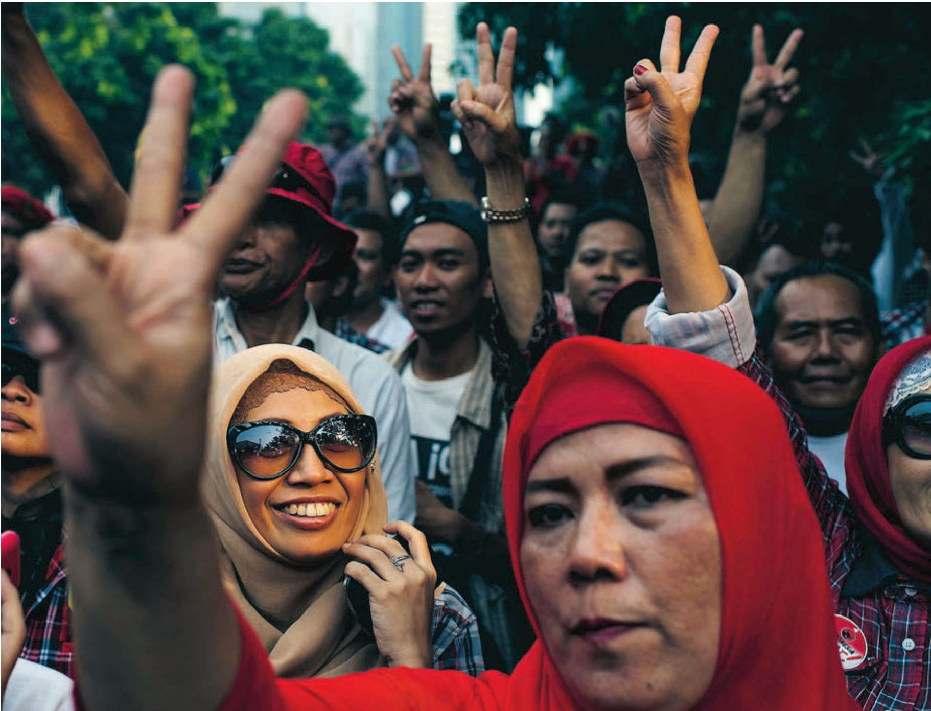
Anhängare av Joko Widodo håller upp två fingrar som symboliserar hans nummer i presidentvalet. Stora delar av Indonesiens artistelit har slutit upp bakom Joko Widodo.