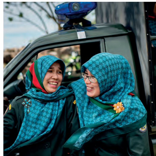
Shariapoliserna patrullerar huvudstaden Banda Acehs gator och utdelar varningar till unga flickor som bryter mot sharialagens klädkod eller som gör något som bedöms vara omoraliskt. Den som fått tre varningar skickas till ett religiöst rehabiliteringsläger i tre dagar.

Enligt siffror från Amnesty dömdes 45 personer i Aceh till spöstraff under 2012. Rafiuddin har en icke oansenlig del av verkställandet på video och klippen avlöser varandra. Dessa filmer ser han som framgångshistorier, exempel på lyckad